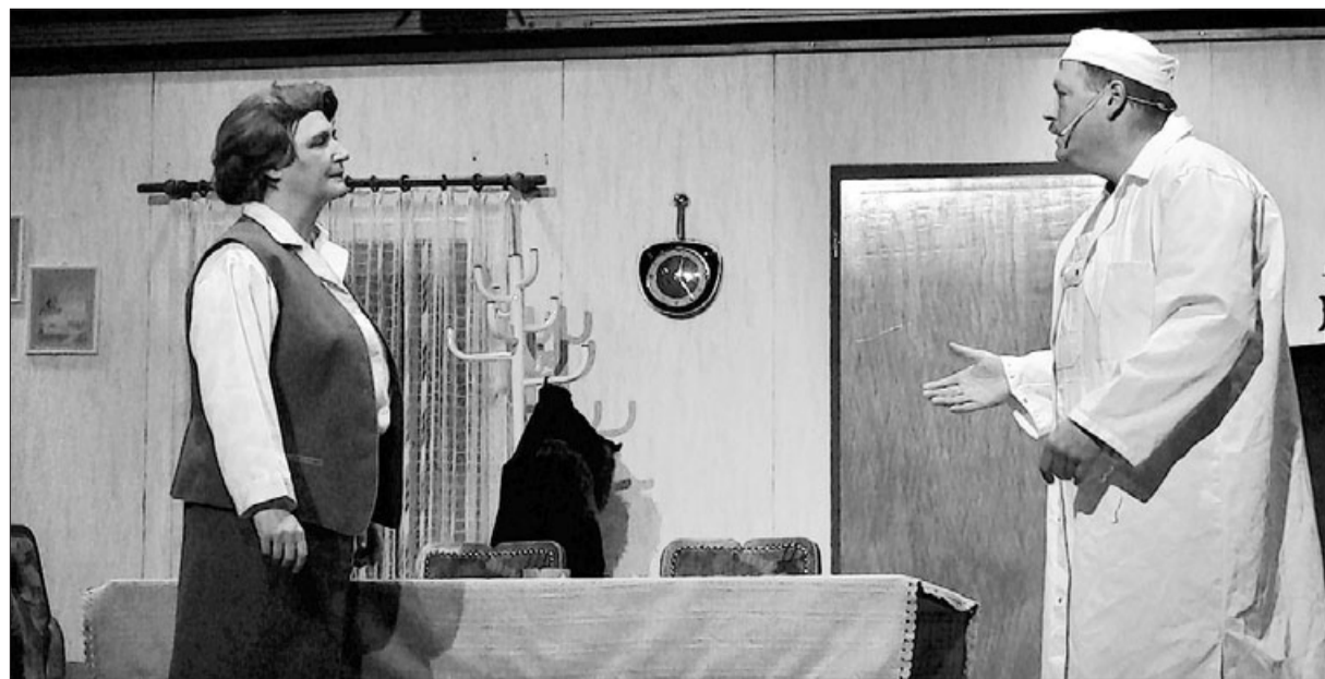
Ein Wohnzimmer aus den 60-er Jahren, die Handlung zeitlos: In Michelbach bringen die Schauspieler das Stück „Über d’Zong g’schtolpert“ auf die Bühne.